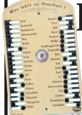
▲ An der Wand: ein mechanischer Einkaufszettel aus der Vorkriegszeit