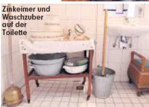
Zinkbeimer und Waschzuber auf der Toilette