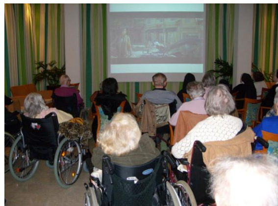
Wintergarten als gut besuchter Kinosaal

Dann folgten im Januar und im Februar, abwechselnd an den Samstagen oder Sonntagen – Kinonachmittag, „Kölsch Klaaf“ Vortrag und Open -Spielnachmittag im Wintergarten.