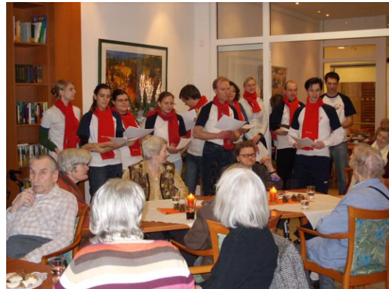
Musikalischer Nachmittag mit Jugendlichen des „Südstadtteams“

Schon die erste Veranstaltung im Dezember letzten Jahres – versammelte im Wintergarten über 50 Bewohner und Angehörigen. Der musikalische Adventnachmittag mit dem „Südstadtteam“ (eine Gruppe von Katholischen Jugend der Pfarrgemeinde St. Severin) war ein unvergessliches Gemeinschaftserlebnis.