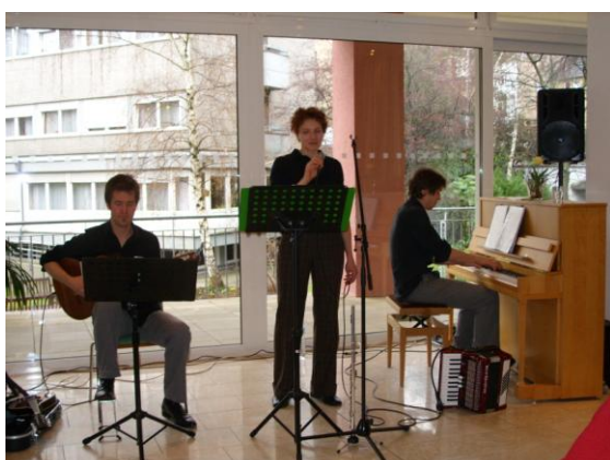
Musiktrio „Caffier“ im Konzert.

Das gelungene Konzert des Trios „Caffier“ war für viele Bewohner ein richtiger Frühlingsauftakt