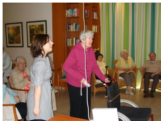
Virtuelles Bowlingspiel für Jung und Alt